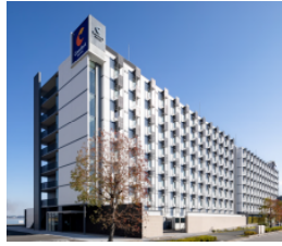
コンフォートホテル 中部国際空港 (本投資法人保有ホテル)