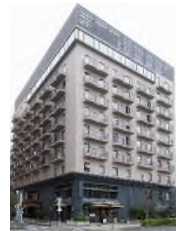
HOTEL THE KNOT YOKOHAMA (本投資法人保有ホテル)