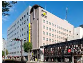
スマイルホテル長野 (本投資法人保有ホテル)