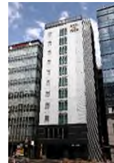
スマイルホテル 品川泉岳寺駅前