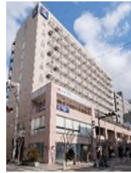
コンフォートホテル 大阪心斎橋 (本投資法人保有ホテル)