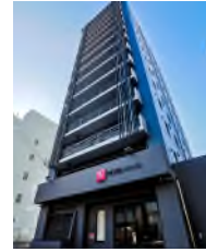
ホテルウィング インターナショナル 高松