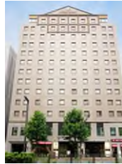
ホテルウィング インターナショナル プレミアム東京四谷