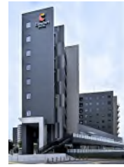
コンフォート ホテル 名古屋金山