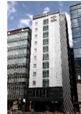
スマイルホテル 品川泉岳寺駅前