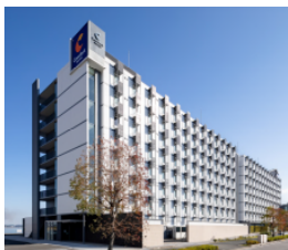
コンフォートホテル 中部国際空港 (本投資法人保有ホテル)