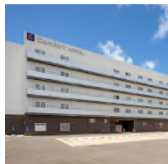
コンフォートホテル 石垣島