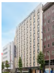
コンフォートホテル 浜松 (本投資法人保有ホテル)