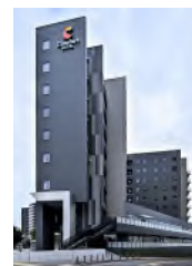
コンフォートホテル 名古屋金山