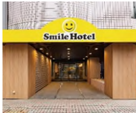
スマイルホテル 東京阿佐ヶ谷 (本投資法人保有ホテル)