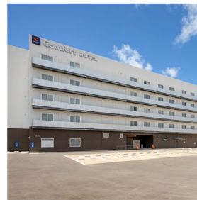
コンフォートホテル石垣島