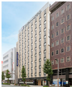
コンフォートホテル浜松 (本投資法人保有ホテル)