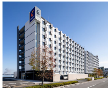
コンフォートホテル中部国際空港 (本投資法人保有ホテル)