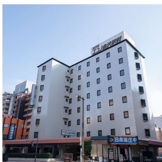
ホテルエコ金沢駅前