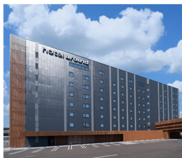
hotel around TAKAYAMA