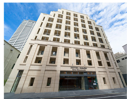
HOTELメリケンポート神戸元町