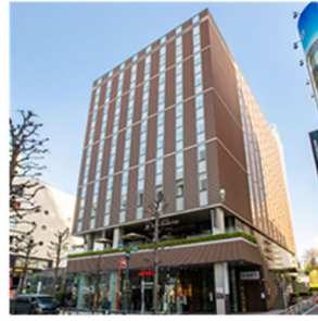
ホテルウイングインターナショナル プレミアム渋谷