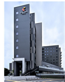
コンフォートホテル 名古屋金山